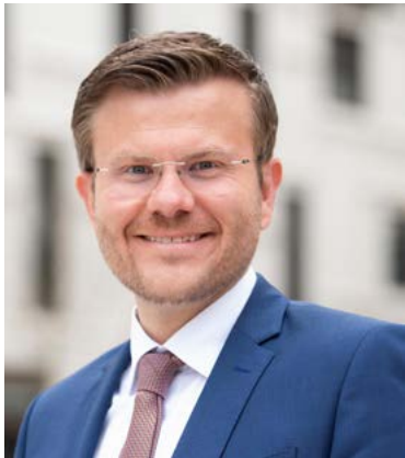
Marcus König Oberbürgermeister der Stadt Nürnberg

Mit der Weiterentwicklung der bisherigen Strukturen im datenbasierten kommunalen Bildungsmanagement und dem gewählten Schwerpunktthema „ Integration durch Bildung “ soll die ganzheitliche Beratung zur Sprach- und Weiterbildung die Integration in den Arbeitsmarkt stärken und Teilhabe an der Stadtgesellschaft ermöglichen.